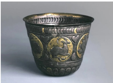
Рис. 1. Урсдонский кубок (Государственный Эрмитаж, инв. № КЗ-5322).

Сама находка (рис. 1), время и место ее изготовления, имеющиеся аналогии обстоятельно разбираются К.В. Тревер в статье «Сасанидский серебряный кубок из Урсдонского ущелья в Северной Осетии», опубликованной в IV томе «Трудов Отдела Востока (Государственного Эрмитажа)» [1]. В том же томе имеется статья Е.Г. Пчелиной, где рассказывается об обстоятельствах находки и дальнейшей, «музейной», истории замечательного предмета иранской тореvтики [2].