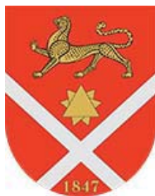
Герб г. Беслан [3, 2]